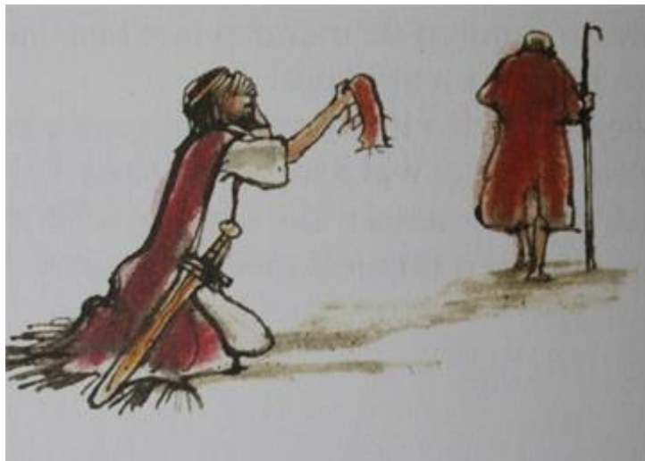
De mantel en de weg. Gezang 831.